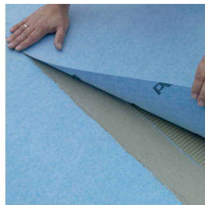
Mit der PCI Pecilastic W können feuchtigkeitsempfindliche Untergründe schnell und sicher abgedichtet werden.