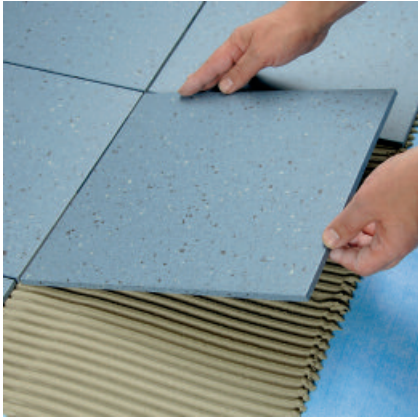
Nach dem Aushärten des Dünnbettmörtels können auf PCI Pecilastic W Keramik- und Naturwerksteinbeläge verlegt werden.