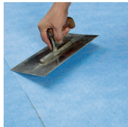
Bahnen mit Traufel, Gummiwalze oder Klopfbrett andrücken.