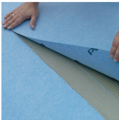
Innerhalb der klebeoffenen Zeit die folgende Bahn einlegen.