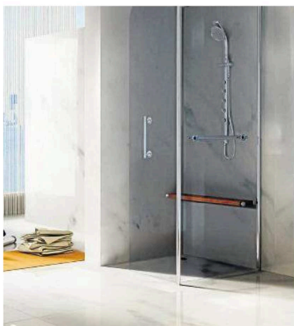
Große Fliesen kommen mit wenigen Fugen aus. Ein geringer Fugenteil erleichtert die Pflege des Bades.

Das Material, dass diese Flexibilität unter den Fliesen ermöglicht, heißt Feinsteinzeug. „Wie bei einer Marmor-